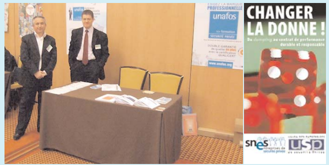
Le stand Unafos lors de la Convention Nationale de la Sécurité Privée SNES-USP du 8/04/2008

Dans le cadre de sa politique de communication et de promotion du secteur et de ses membres, l'Unafos a participé aux villages de partenaires de la 1ère «Convention Nationale de la Sécurité Privée» organisée le 8 avril dernier à Paris-Bercy par les deux organisations patronales de la branche prévention et sécurité : le SNES et l'USP, qui font partie de ses membres fondateurs.